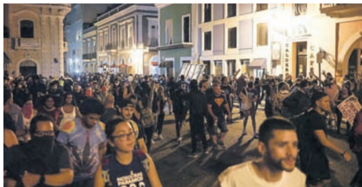
SAN JUAN (ElNuevodia/CNN) - Manifestantenan pidiendo renuncia di gobernador di Puerto Rico, Ricardo Rossello, a reuni dilanti mansion di e gobernador diasabra atardi, cantando y batiendo

riba wea y panchi den e mas recien demostracion pa exige renuncia di e mandatario.